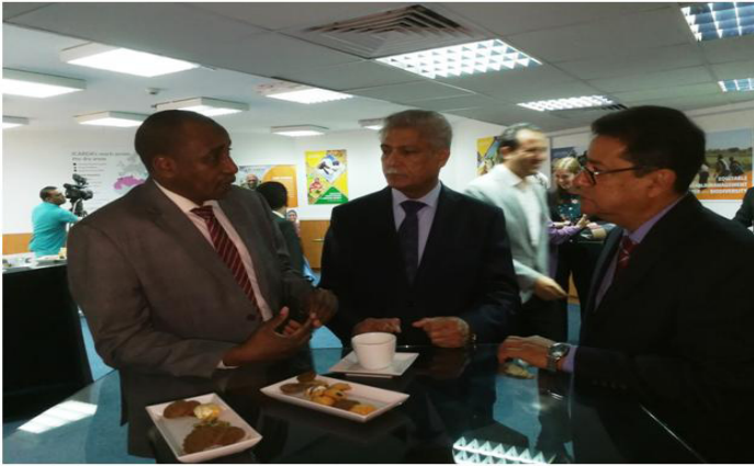
افتتاح المقر الجديد لايكاردا - مصر