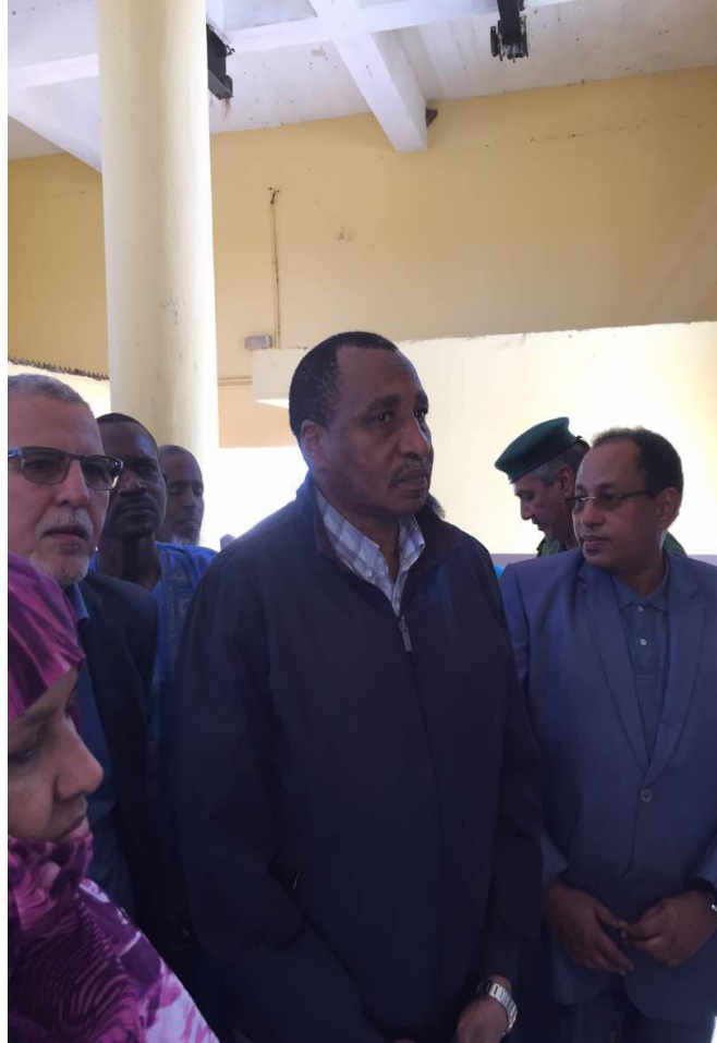
معالي البروفيسور الدخيري المدير العام للمنظمة العربية للتنمية الزراعية لدى زيارة ولاية أترارزة