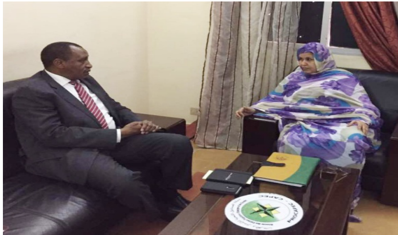
معالي البروفيسور الدخيري المدير العام للمنظمة العربية للتنمية الزراعية و وزيرة البيطرة الموريتانية