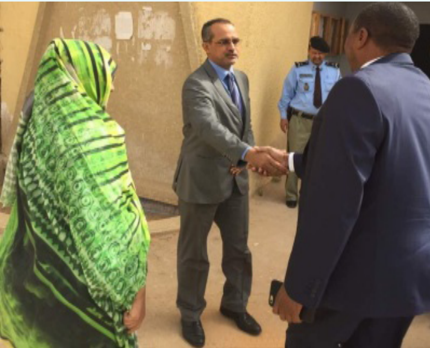
لقراءة الخبر كاملا أرجو الضغط على الموقع الالكتروني أدناه http://aoad.org/news9-nov-2017-2.htm

قام معالي البروفيسور إبراهيم آدم الدخيري، بزيارة إلى المعهد الوطني للأراضي والسقي وصراف المياه بالجزائر. وقد عقد معاليه جلسة عمل مع طاقم المعهد، قدمت له خلالها شروح تعريفية بالمعهد والمهام الموكلة له في مجال استصلاح الأراضي.