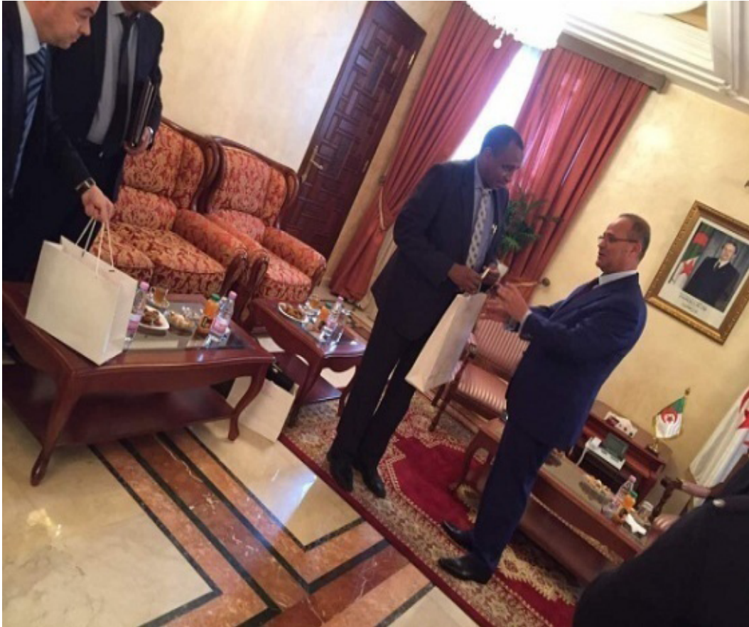
معالي وزير الفلاحة والتنمية الريفية والصيد البحري في الجزائر يستقبل معالي البروفيسور مدير عام المنظمة العربية للتنمية الزراعية