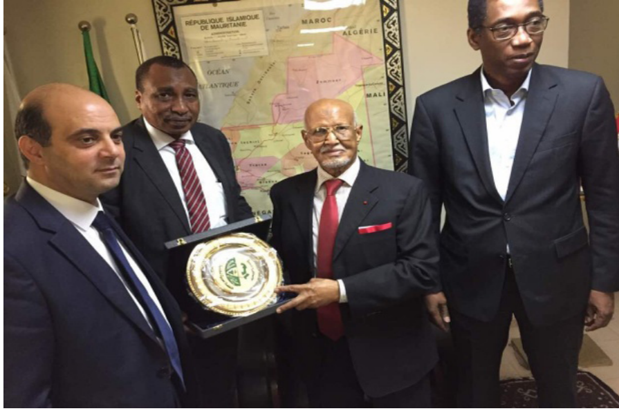
معالي البروفيسور الدخيري المدير العام للمنظمة العربية للتنمية الزراعية و الوزير الأول في موريتانيا