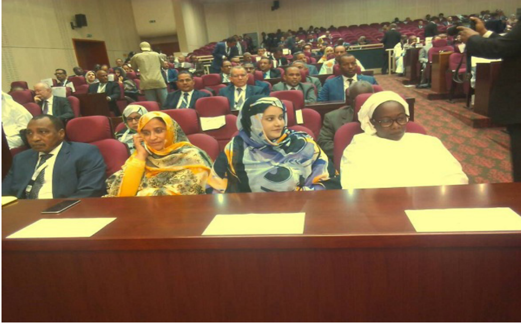
فعاليات افتتاح الملتقى الاستثماري حول الثروة الحيوانية